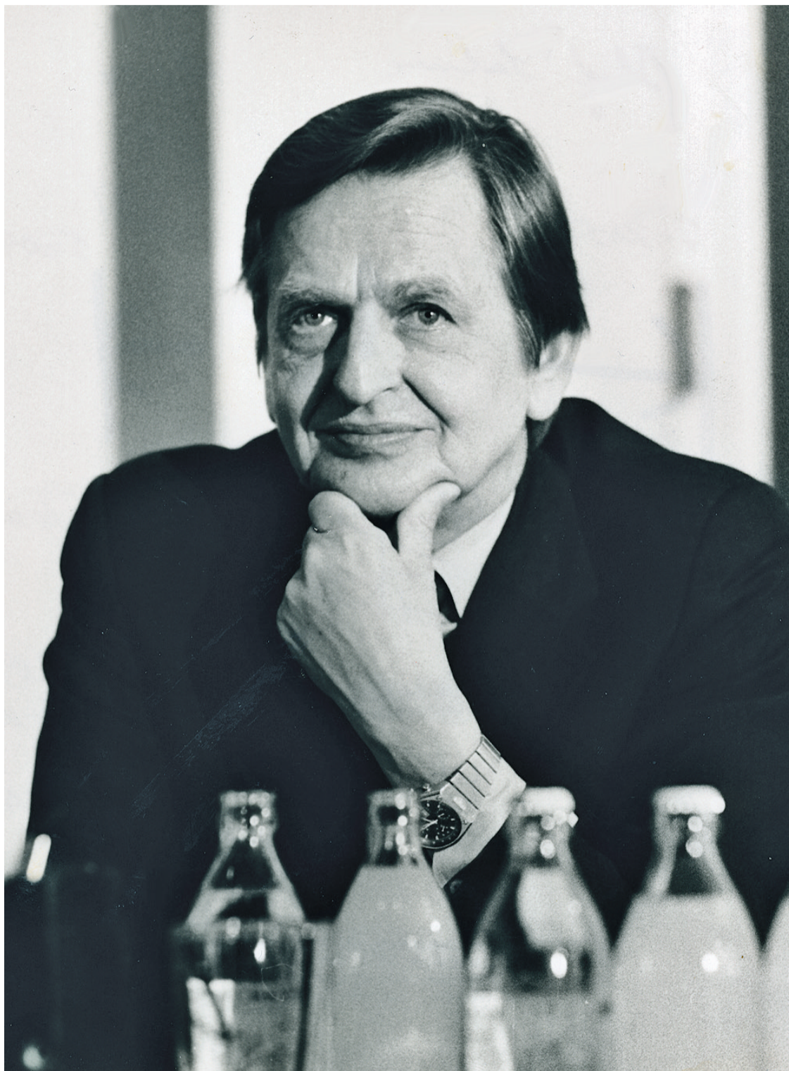
Olof Palme oli pohjoismaalaisen solidaarisuuskäsityksen vankkumaton tukipilari.