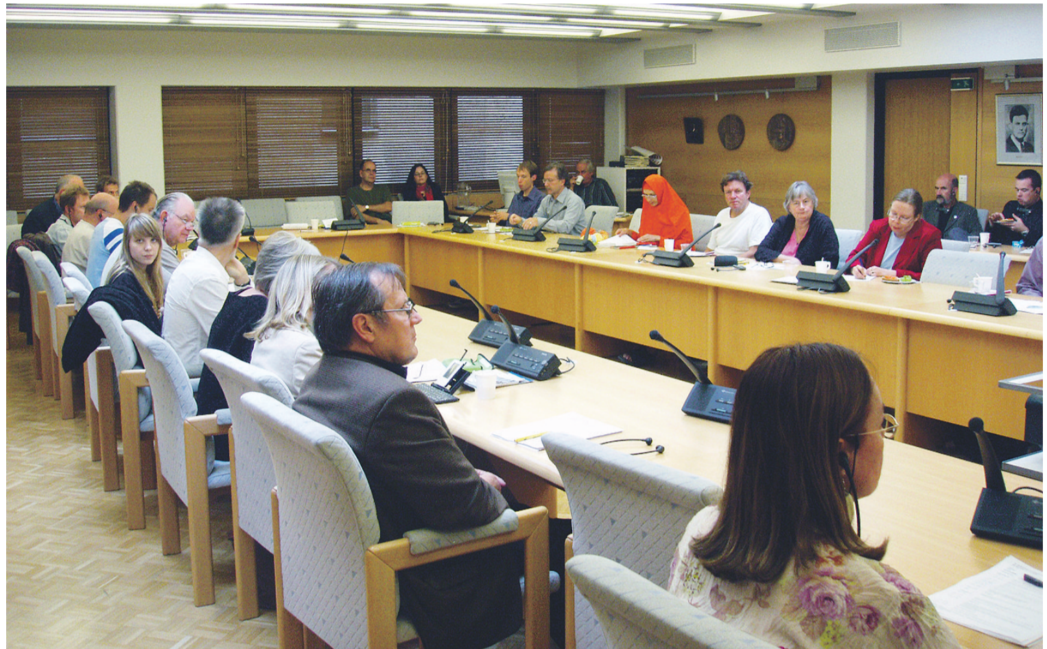
Veu:n järjestämässä Euroopan tulevaisuuskonfressissa oli runsas kansainvälinen osaanotto.

uotsalainen Goudin kertoi hdessä Tanskan Lave rochin elämästä eurottomassa yhteiskunnassa. Sekä tanskalaiset että ruotsalaiset pitivät yhteisvaluuttan sitoutumattomuuttaan hyvänä ratkaisuna. Rahaliiton ulkopuolella syytely ei suinkaan johtanut maiden talouden romahtamiseen, vaikka innokk-