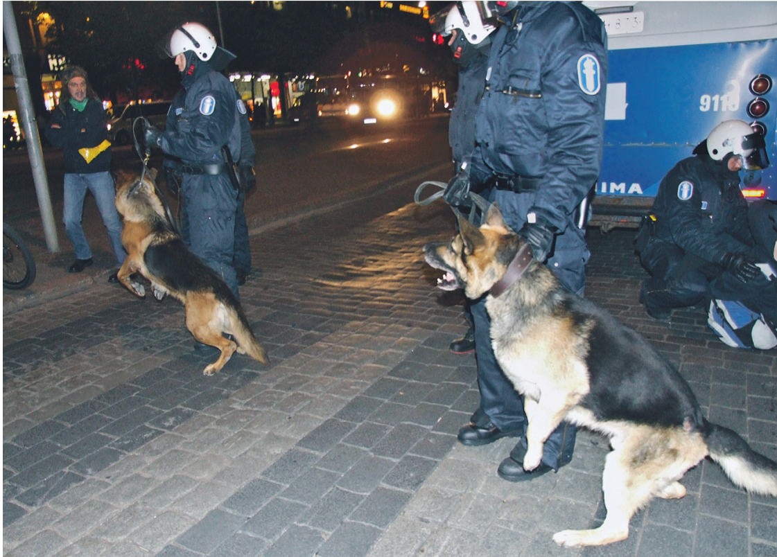
Poliisit näyttivät ASEM-mielenosoituksessa mitä verorahoilla saa.